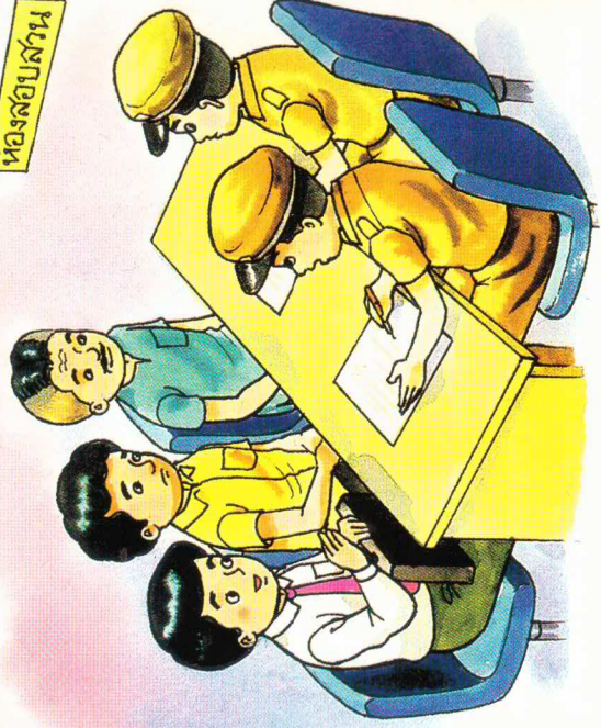
ห้องสอบสวน